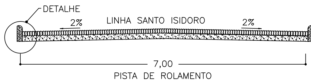
SEÇÃO TRANSVERSAL DO PAVIMENTO sem escala

NÃO SERÁ EXECUTADO PASSEIO EM FUNÇÃO DA VIA À PAVIMENTAR SER UMA VIA DE LIGAÇÃO AO INTERIOR SENDO O MEIO-FIO ENGASTADO AO SOLO E TRAVADO COM ATERRO CONFORME ESPECIFICADO EM PROJETO