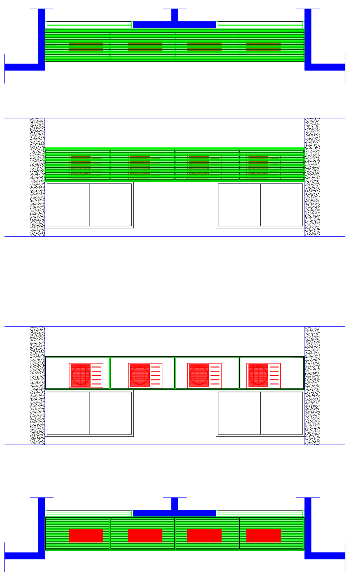
DETALHE CAIXA METÁLICA AR CONDICIONADO 1

CRAS PORTE I E II — PLANTA BAIXA & ACESSIBILIDADE Piso Tátil interno ÁREA: 165,30 m 2