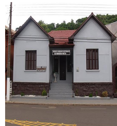
Museu Municipal Pedro Lorenzoni

-Restaurar, pintar, reformar o Museu Municipal, além de Conservar, restaurar o arquivo